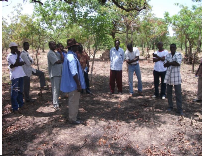
Un parc à karité promu par la RNA dans la province du Passoré